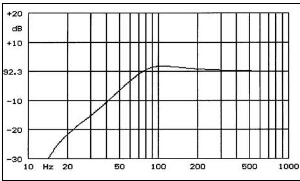
Frequenzgang- Bass: Computer-Simulation